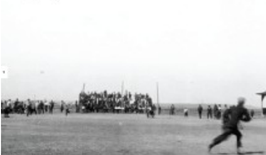
Αγώνας μπίτζμπολ στο Λάντλοου

Εκείνο το βράδυ, υπό την κάλυψη του σκοταδιού, οι πολιτοφύλακες μπήκαν στον καταυλισμό και έβαλαν φωτιά σε σκηνές, σκοτώνοντας δύο γυναίκες και έντεκα παιδιά που είχαν βρει καταφύγιο από τους πυροβολισμούς σε ένα λάκκο κάτω από μια σκηνή. Δεκατρείς άλλοι άνθρωποι πυροβολήθηκαν και σκοτώθηκαν επίσης κατά τη διάρκεια των μαχών.