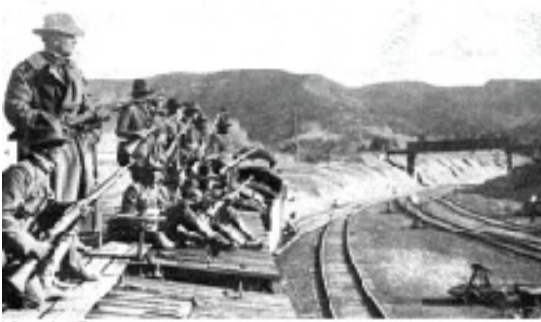
Η εθνοφρουρά των ΗΠΑ