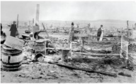
Το Λάντλοου μετά τη σφαγή