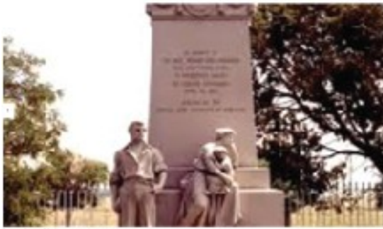
Το μνημείο του Λάντλοου